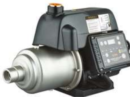
MAGNET AUTO 750