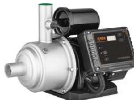
HP INOX AUTO